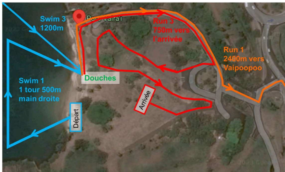
Plan du parc Vairai pour la VODAFONE SWIMRUN RACE de PUNAAUIA 2023

Remarques : Lors du Swim 1, les longues (leachs) ne sont pas autorisées.